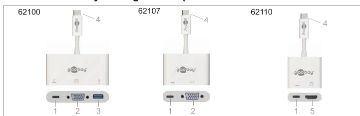
Fig. 8: Elementy obsługowe i części