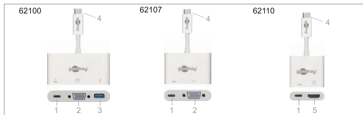
Fig. 5: Eléments de commande et pièces