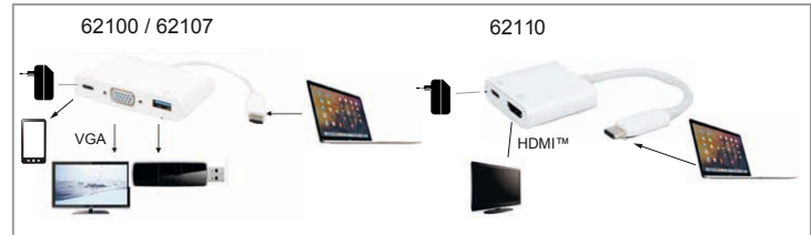
Fig. 2: Anschluss

Bei Verbindung des USB-C™-Steckers mit einem Chromebook funktioniert die Maus, die an der USB-3.0-Buchse angeschlossen ist, erst mit einigen Sekunden Verzögerung.