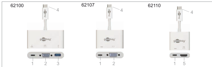
Fig. 1: Bedienelemente