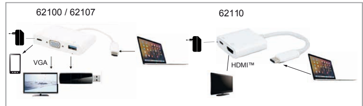
Fig. 4: Connecting

Don't disconnect the USB-C™ multiport adapter with USB-C™ charge connection from power supply while transferring data to avoid loss of data.