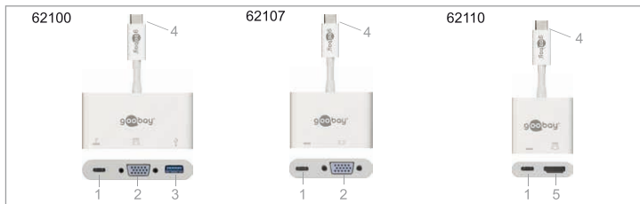
Fig. 3: Operating elements