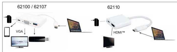
Fig. 6: Connexion

Ne débranchez pas l'adaptateur USB-C™ multiport pendant le transfert de données afin d'éviter toute perte de données.