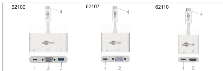
Tab.4: Eléments de commande